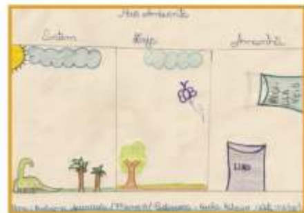
Visão dos alunos sobre o meio ambiente: ontem, hoje e amanhã.