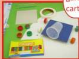
carrinho de sopro

Que carrinho legal! Feito de sucata, igual a mim! Anotem o material e façam também: copo descartável, tampinha de garrafa, giz de cera, cartolina e fita adesiva.